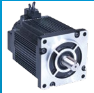
Motor de transmisión