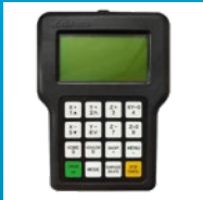
Control numérico DSP