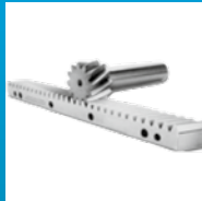
Sistema de transmisión ejes XY