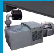
Bomba de vacío