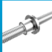
Sistema de transmisión eje Z