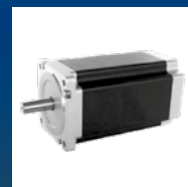
Motor de transmisión