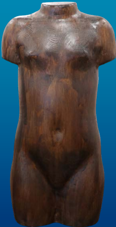
Mecanizado de busto 3D en madera