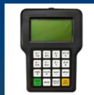
Control numérico DSP

Para el manejo del 4º eje es necesario el software Deskproto capaz de crear sencillos mecanizados a través de sus asistentes en español de hasta 4 ejes. www.deskproto.com