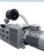
Bomba de vacío