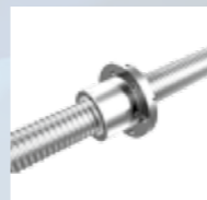
Sistema de transmisión eje Z