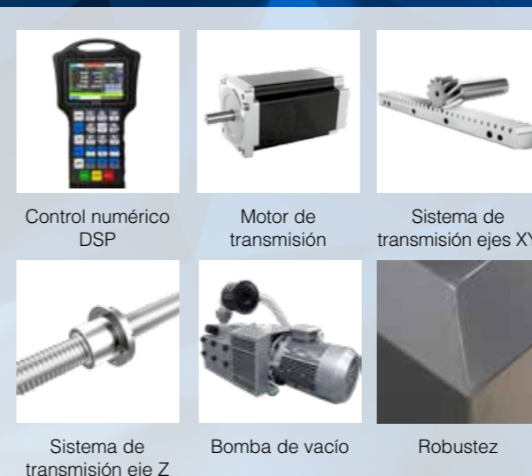
Control numérico DSP